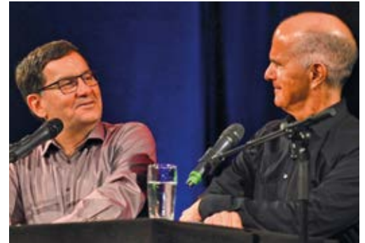
Moritz Netenjakob und Christoph Maria Herbst bewiesen intelligente Albernheit.

lenwechseln. Dabei erinnern sie an die Großen. Herbst: „Loriot ist unser Vorbild, dessen Schuhe nur schwer passen. Er hat den menschlichen Wahnsinn bestens beschrieben.“ Sie erwiesen dem Meister die Ehre mit dem Dialog „Feierabend“, dessen berühmtes Zitat „Ich sitze hier“ in allen Ohren nachhallt. Realsatire ist auch die Leidenschaft von Herbst und Neten-