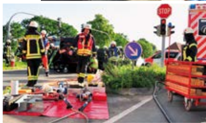
Nach dem massiven Aufprall überschlug sich der Ford und lag auf dem Dach. Mutter und Tochter in dem PKW hingen in ihren Sicherheitsgurten.

Feuerwehkräfte, Sanitäter und Notarzt befreiten die Insassen.