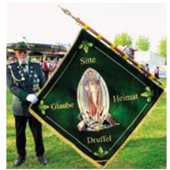
Bruderschaftsfahne Bildseite. Motiv: „Jesus als Guter Hirte“.