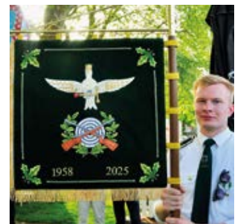
Jungschützen-Standarte Bildseite mit Vogel und Schützensymbol.