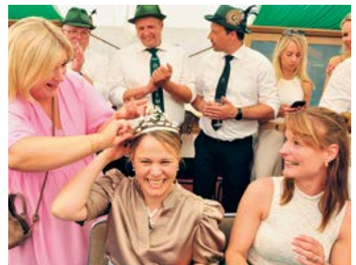
„Schmerzvoller Machtverlust“ bei Königin Corinna I. Die neue Nicole wartet schon gespannt auf ihre Krönung.