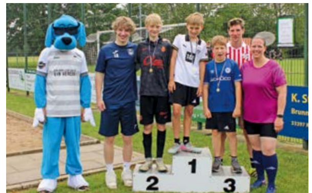
Den Familiencup konnte das Team „Lokomotive Lintel“ für sich entscheiden.