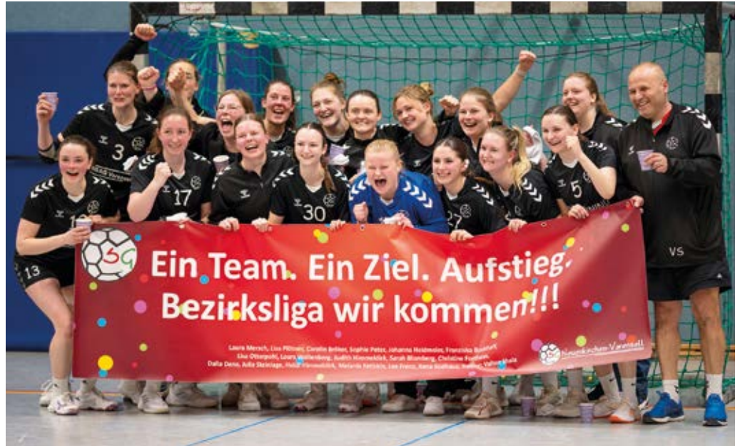
Die erfolgreichen Handballfrauen vom TuS Westfalia Neuenkirchen feierten den Aufstieg.

Aus dem Seniorenbereich wurde ebenfalls überwiegend Positives berichtet. Die 1. Damenmannschaft sicherte sich den Aufstieg in die Bezirksliga, während sich auch bei der 2. Damenmannschaft eine erfreuliche sportliche Entwicklung zeigt. Bei den Herrenmannschaften steht vor allem der Klassenerhalt in der Bezirksliga der 1. Herren im Fokus, zudem wurden Änderungen im Trainer- und Betreuerstab bekanntgegeben. Der Spielbetrieb der laufenden Saison verläuft insgesamt reibungslos. Allerdings kam es