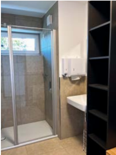
Toiletten und Duschen gab es bisher direkt am Sportplatz nicht.