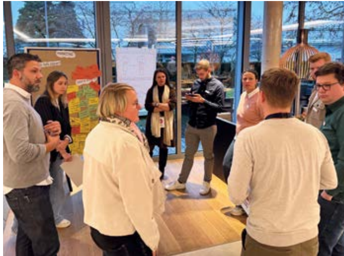
Workshop zur Vorbereitung des Talent Events zusammen mit den Ausstellern im heroal Bistro

An zwei Veranstaltungstagen präsentieren sich zahlreiche Unternehmen, Institutionen und Bildungseinrichtungen aus unterschiedlichsten Branchen – vom Handwerk über Industrie und Pflege bis hin zum öffentlichen Dienst. Besucherinnen und Besucher erhalten direkte Einblicke in Ausbildungsberufe, Studiengänge, Praktika sowie Karriere- und Entwicklungsmöglichkeiten in der Region. Der Freitag, 12. Juni, steht ganz im Zeichen junger Talente. Von 8.30 bis 13.00 Uhr haben Schülerinnen und Schüler die Gelegenheit, Ausbildungs- und Stu-