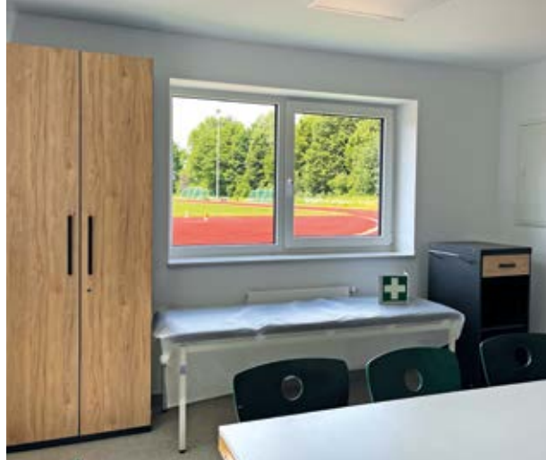
Der Erste-Hilfe-Raum, der gleichzeitig als Besprechungsraum für Zusammenkünfte genutzt werden kann.