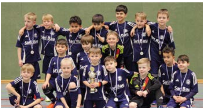
Auch die U9-Mannschaft des Gastgebers konnte einen Torerfolg feiern.