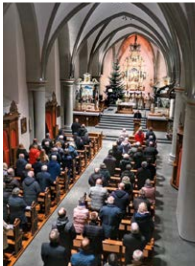
Die Übergabe der Pastoralvereinbarung während des Gottesdienstes in der Klosterkirche fand große Resonanz.

Die Pastoralvereinbarung beschreibt in einer grundlegenden Veränderungssituation der katholischen Kirche das Ergebnis des Such- und Planungsprozesses zur zukünftigen Handlungsweise. Dazu bilden sich in den Gemeinden Steuerungsgruppen, die von Beratern des Erzbistums begleitet werden. Über die Vorgehensweise steht in der Pastoralvereinbarung: „Wir haben uns angeschaut, was in unseren Gemeinden geschieht. Es ist beeindruckend und erfüllt uns mit Dankbarkeit. Viele Gemeindemitglieder engagieren sich und prägen das Gesicht