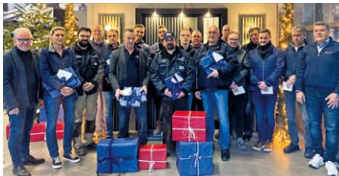
27 Mitarbeiter, die über Jahrzehnte dem Betrieb die Treue halten, konnte das Verler Unternehmen auszeichnen.