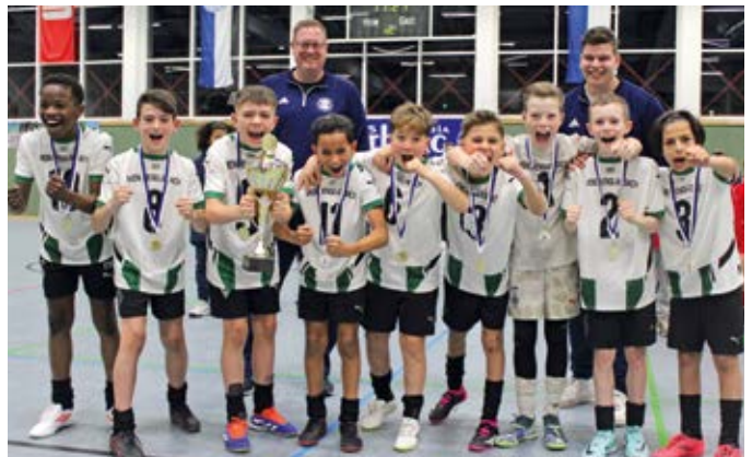
Bei den U11-Kickern konnten sich die Nachwuchstalente vom Borussia Mönchengladbach durchsetzen, vor den Teams des VfL Bochum und Bayer Leverkusen.

men sowohl bei dem U11-Turnier am Samstag, als auch bei dem U9-Turnier am Folgetag tolle Spielzüge, schöne Tore und engagierte Zweikämpfe zu sehen. Nach einem knappen Rennen zwischen Borussia Mönchengladbach und dem VfL Bochum gingen bei der U11 letztlich die Kicker vom Niederrhein als Sieger mit der begehrten Trophäe aus der Halle. Bei der U9 hatte am Ende die andere Borussia aus Dortmund die Nase knapp vor Gladbach und Köln. Die Jungs aus Rietberg schafften zwar keinen Sieg, konnten sich am Ende aber über insgesamt vier erzielte Tore freuen. Und die Erinnerung an die Duelle gegen möglicherweise kommende Bundesliga-Stars sind sowieso Gold wert.