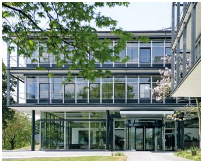
Die Bertelsmann Stiftung in Gütersloh hat die Studie mit der DKJS in Auftrag gegeben.

Zwar geben fast 80 Prozent der befragten Fachkräfte an, dass ihre Tätigkeit im Übergangssektor in den vergangenen fünf Jahren insgesamt schwieriger geworden sei – doch sie sehen auch positive Entwicklungen: Knapp 60 Prozent sind der Ansicht, dass sich die Angebotssituation am Ausbildungsmarkt verbessert hat, und für mehr als drei Viertel sind die Qualifikationsanforderungen der Betriebe einfacher geworden (35 Prozent) oder gleich geblieben