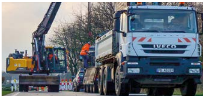
Die Tiefbau-Spezialisten im Einsatz.

Die Firma Bökmann bildet zum Rohrleitungs- und Kanalbauer (m/w/d) aus und freut sich über Bewerbungen für den Ausbildungsstart am 01.08.2025, gerne per E-Mail.