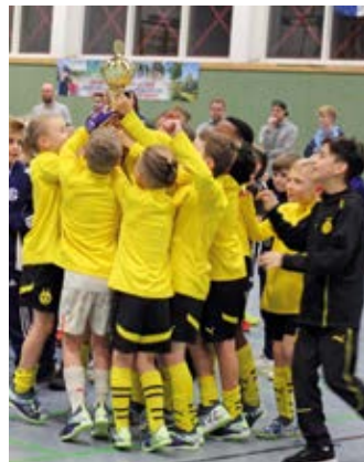
Der Siegespokal für den U9-Nachwuchs ging an die Mannschaft von Borussia Dortmund.