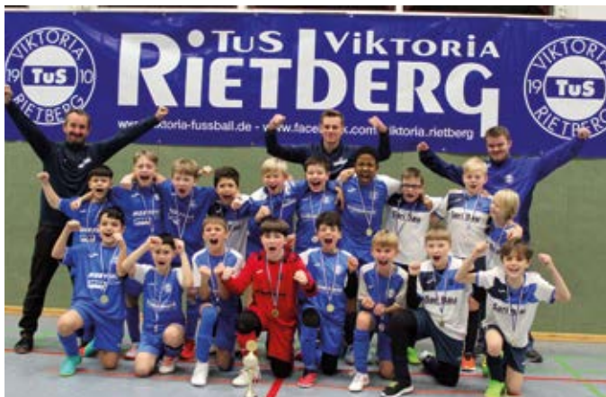
Die U11-Kicker des TuS Viktoria Rietberg erzielten im Turnierver- lauf drei Tore.