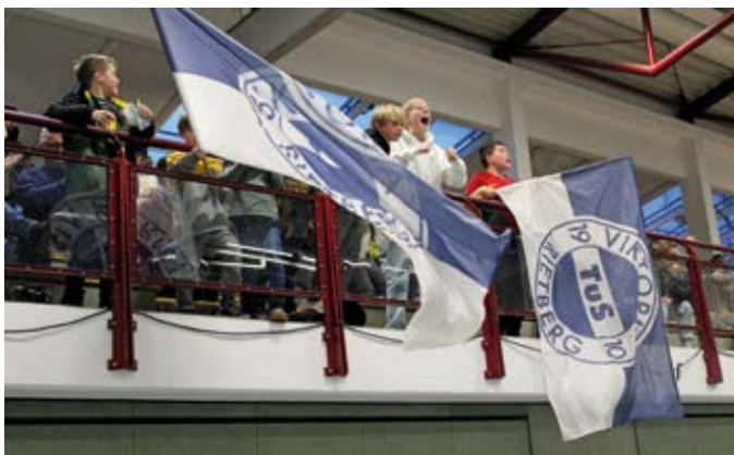
Anfeuern und Mitfieberten – beste Stimmung auf den gut gefüllten Rän- gen der Sporthalle im Schulzentrum am Torfweg.