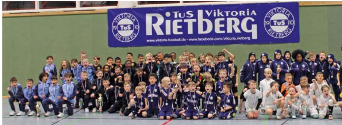
Neben den Gastgebern vom TuS Viktoria Rietberg traten die Nachwuchstalente der Mannschaften vom FC Köln, SV Werder Bremen, Borussia Mönchengladbach, VfL Bochum 1848 und SC Fortuna Köln an.