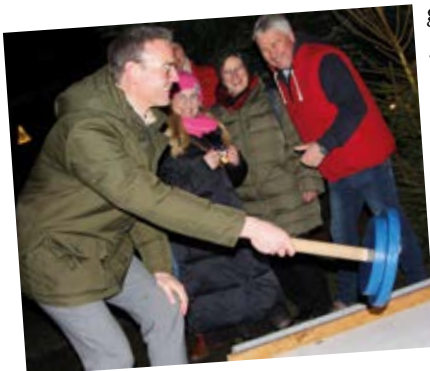
Bürgermeister Andreas Sunder testet sein Geschick beim Eisstockschießen.

junge Chor Varenzell das Publikum mit schönen Melodien. Zu hören waren unter anderem „Frosty the Snowman“, das romantische Lied aus dem Märchenfilmklassiker „Drei Haselnüsse für Aschenbrödel“ und der bekannte Weihnachtssong „Feliz Navidad“. Eine ganz besondere Premiere gab es ebenfalls an diesem Tag. Der Bürgerverein Varenzell schenkte erstmals an seinem Stand einen neu kreierten und selbst vermarkteten Bierlikör aus. Der Name der Spirituose lautet „Wiehenpeter 19“, zurückgehend auf den Gründer der ehemaligen Gaststätte Hesse, wo das neue Bürgerhaus entsteht. Dem Projekt kommen natürlich auch die Einnahmen zugute.