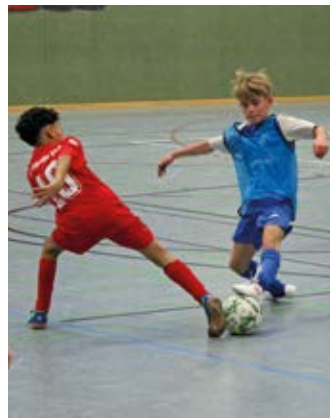
Schalke 04, Borussia Dortmund, 1. FC Spannende Zweikämpfe waren an beiden Tagen zu sehen.