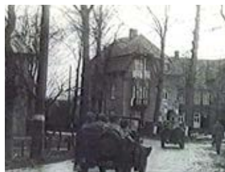
Dieses Foto ist ein Bildausschnitt von einem schwarz-weiß Film den die amerikanischen Besatzer am 31. März 1945 gedreht haben, als sie von Wiedenbrück kommend nach Neuenkirchen fuhren.