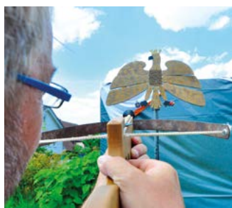
Mit Miniarmbrust zum Königstitel.