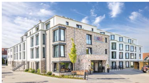
Die hellen und freundlichen Einzelzimmer mit einer Größe von ca. 23–24m 2 inkl. barrierefreiem Bad bieten den Bewohnern die Möglichkeit, eigene Möbel mitzubringen.

Auf dem ehemaligen Gelände der Gärtnerei Grundmeier befindet sich heute die neue Seniorenresidenz der Curavie. Mit einem professionellen Pflegekonzept nach höchsten Qualitätsstandards bietet die