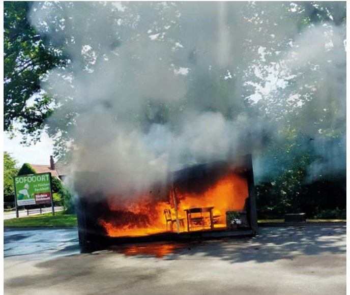
Demonstration von Brand und Löscharbeiten gehören zum Programm.

Lerchenweg 2 · 33397 Rietberg Tel. 052 44/7 00 08-0 info@elektrobergmeier.de