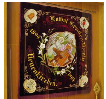
Im Jahre 1924 wurde zum 25-jährigen Jubiläum die neue Fahne eingeweiht.