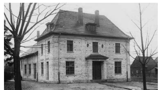
1928 ein eigenes Gesellenhaus errichtet