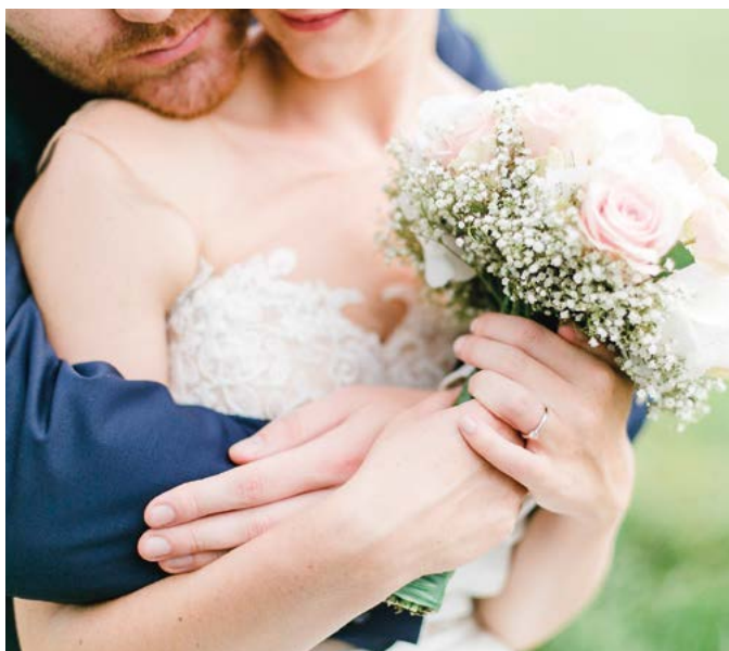
Damit der Ablauf einer Hochzeitsfeier kein Reinfeld wird, setzt der Bund deutscher Hochzeitsplaner auf Seriosität.

Laut statistischem Bundesamt wurden im Jahr 2019 416.300 Ehen geschlossen. Besonders beliebt sind hierfür alljährlich die Sommermonate. Daher beginnen im Herbst für viele Brautpaare die eigenen Hochzeitsvorbereitungen. Doch wie finden und erkennen Brautpaare kompetente Dienstleister? Woran erkennt man aus der Vielzahl der Angebote einen seriösen Hochzeitsplaner? Seit Gründung des Bundes deutscher Hochzeitsplaner im Jahr 2007 ist die Anzahl zwischenzeitlich von 7 auf 28 Mitglieder angestiegen (27 Vollmitglieder, 1 YoungStar). Dies zeigt in der stetig wachsenden Hochzeitsbranche, wie wich-