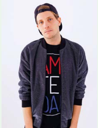
Axel Fischer