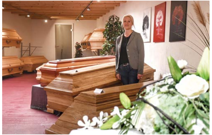
Die Auswahl des Sarges oder der Urne gehört ebenso zur Beratung der Bestattungsvorsorge wie Auswahl von Ort und Kosten.

Die Festlegung der Bestattungsart, die Auswahl des Bestattungsortes und die finanzielle Absicherung der Bestattungskosten gehören mit in das Vorbereitungsgespräch. „Es ist vor allem auch