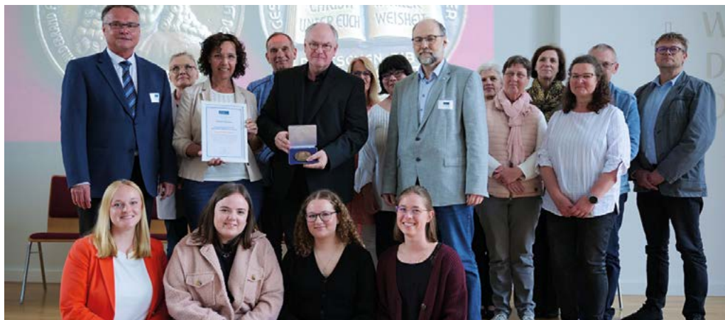
Canstein-Medaille: Das Ehepaar Fricke nimmt die Auszeichnung entgegen.