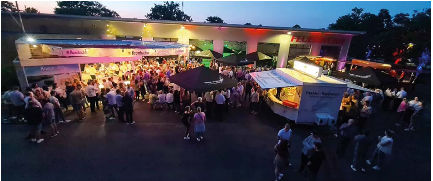
Ein Besuchermagnet: Das traditionelle Feuerwehrfest lockt zahlreiche Besucher nach Neuenkirchen.