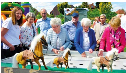
Mordsgaudi beim Pferderennen.