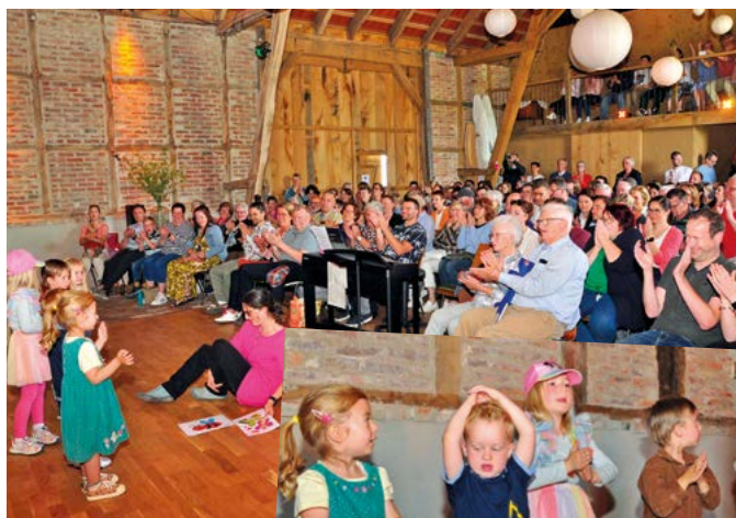
Eroberten die Herzen des Publikums. TonARTisten, die Jüngsten beim Konzert.