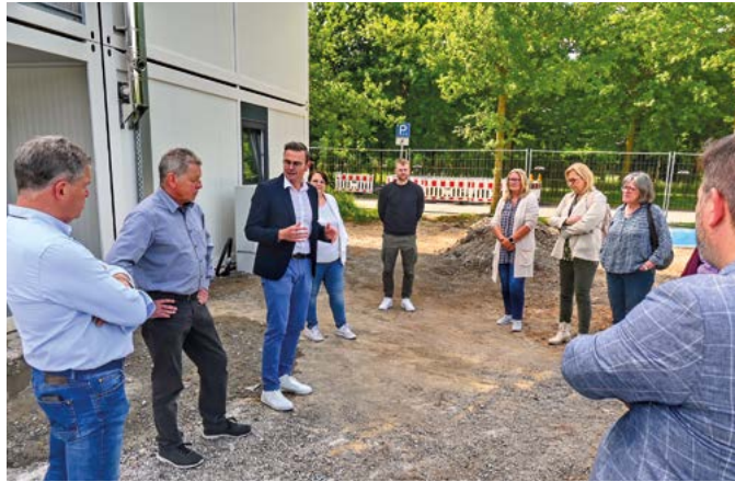
Der Ausschuss für Sport, Kultur und Soziales beim Ortstermin: der neue zweistöckige Wohncontainer für Asylsuchende in Neuenkirchen hält 80 Plätze bereit.