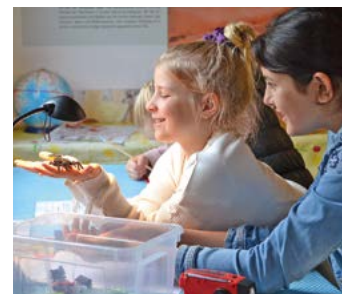
Schülerinnen der Emsschule in Rietberg experimentieren im ‚Grünen Klassenzimmer‘ mit der Energie aus Licht.

Lernort geschaffen. Unter dem Motto ‚Entdecken, erleben, begreifen‘ geht es in den Kursen des ‚Grünen Klassenzimmers‘ auf dem Landesgartenschau-gelände darum, Kinder und Jugendliche für Naturwissenschaften und Umweltthemen zu begeistern, Wissen zu vermitteln und Handlungskompetenzen zu fördern.