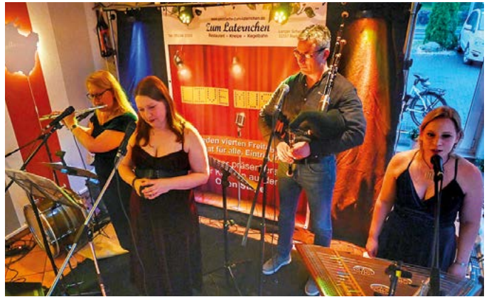
Gariad hat sich gerade erst neu formiert und bekam viel Applaus für den zweiten Auftritt seit Gründung